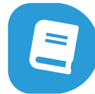
LIVRE BLANC SUR LA RSE