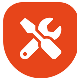
BOÎTE À OUTILS DE FORMATION